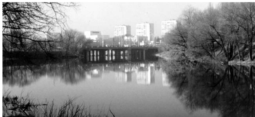
Місто Суми. Тихоплинний Псел.

Активно працює товариство в 2004 році, оголошеному роком Польщі в Україні. Проходять також і заходи, пов'язані зі вступом Республіки в Європейський союз. Серед особливо пам'ятних – концерт польської народної і сучасної музики в МЦ «Собор» та наукова конференція в обласній бібліотеці.