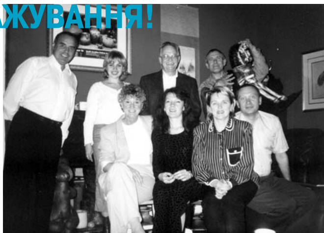
Жовтень 2002 року. Група сумчан в американській сім'ї під час стажування в місті Луїсвіл.

Для фахівців, які працюють з проблемами ВІЛ/СНІДу та наркоманії потрібно: працювати в державній, громадській чи приватній організації, яка займається лікуванням, тестуванням або профілактикою ВІЛ/СНІДу та наркоманії, соціальною чи реабілітаційною роботою з інфікованими. До програми вийдуть відвідини американських організацій, які працюють із визначеними проблемами, се-