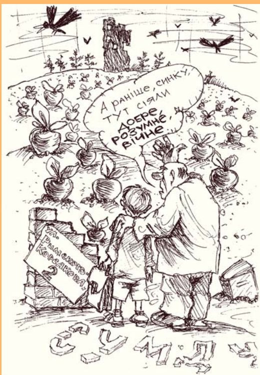
МАЛЮВАВ ДЛЯ "СХОДИН"