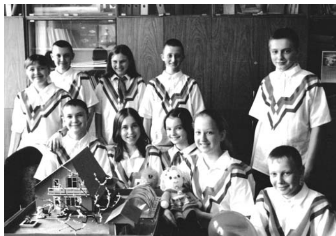
Активісти громадської організації «Спілка піонерів Сумщини»

У містах Глухів та Путивль перебувала делегація членів ради громадської організації «Сумське земляцтво в м. Києві». В рамках візиту земляки провели зустріч із керівництвом міст, викладачами та студентами Глухівського педагогічного університету, взяли участь у покладанні квітів до Меморіалу загиблим воїнам у Глухові та до пам'ятників С.А.Ковпаку і С.В.Рудневу у Путивлі, відвідали місцеві краєзнавчі музеї та оглянули історико-культурні об'єкти: храм Трьох Анастасій і Миколаївський храм у Глухові, монастирь Глиньська Пустинь у Глухівському районі, Софронівський та Молченський монастирі у Путивльському районі.