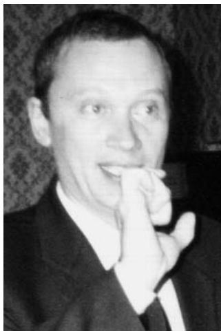
Володимир САДІВНИЧИЙ БАНАЛЬНОСТІ