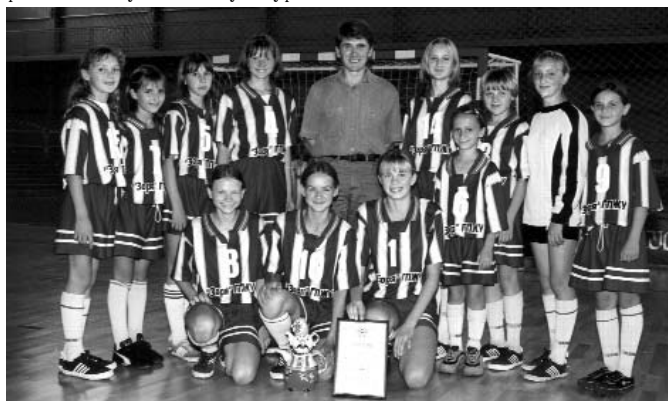
Футзальна команда «Зоря».

Неабияким досягненням стало створення в Сумах навчально-методичного центру, який здійснює консультаційну допомогу жінкам із різних питань – юридичних, медичних, психологічних тощо. Потрібного досвіду набули члени осередку, ставши учасниками програми «Формування активної стратегії соціального партнерства на Сумщині», а також співпрацюючи з Сумським гендерним центром,